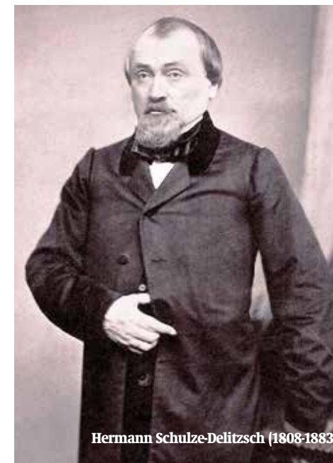
Hermann Schulze-Delitzsch (1808-1883)

»Nein, der Realist, der den genossenschaftlichen Gedanken im gesell-